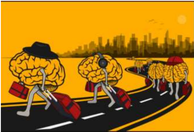
Disponível em: < https://media.istockphoto.com/id/1170180978/vector/brain-drain.jpg?s=612x612&w=0&k=20&c=i6CcYwcPa7oq4RtuyonLtwAJn74o3UyWEtt4HqQM_Cs=>. Acesso em: 08 de out. 2023.

A imagem retrata qual fenômeno social da atualidade?